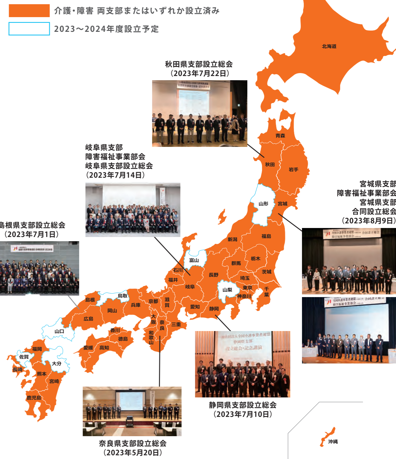
Legend: 介護・障害 両支部またはいずれか設立済み (Established both care and disability branches or either); 2023~2024年度設立予定 (Planned for establishment in FY2023-2024)