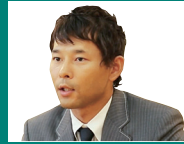
関西支部設立から1年を経て