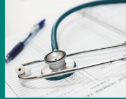
診療報酬改定のポイントおよび介護業界への影響について