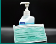
新型コロナウイルス感染症について